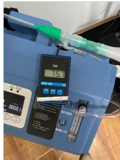
Max. 75,7 % zuurstof tijdens Light sessie